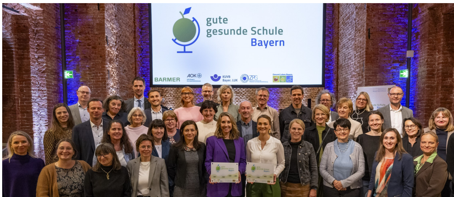
Ministerinnen Anna Stolz und Judith Gerlach (vorne, Bildmitte) zeichneten die Schulen aus und überreichten die Urkunden an die anwesenden Schulleitungen.