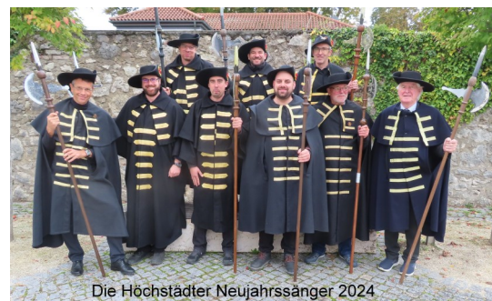
Die Höchstädter Neujahrssänger 2024