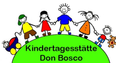
Bild: Kita Don Bosco

Vielen Dank an die Kath. Kirchenstiftung und die St. Simpert-Stiftung, die diese Gruppe in Ihre Trägerschaft wieder übernommen haben.